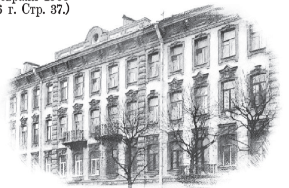
Дом 13 по Сергѣевской