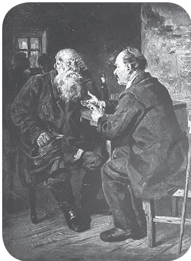
В.Е. Маковский. Ходатай по делам

2) Из них Министр отберет только тех, коих способности и поведение достаточно засвидетельствованы для включения их в список стряпчих, коих число может он по усмотрению на первый случай определить соразмерно с числом тяжущихся, так как ему оное лучше всех известно, по количеству находящихся дел.