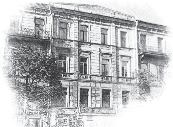
Дом 15 по Сергиевской

Каждому участнику полицией вручались объявления с таким содержанием: