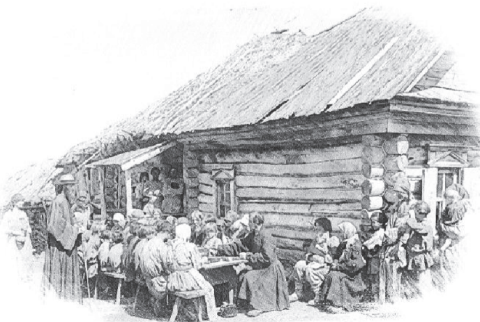
Народная столовая. Нижегородская губерния, Сергачский уезд. Рисунок с фотографии М.П. Дмитриева

Вести из С.-Петербургского Совета. «Со всех концов Россия горячо отозвалась к бедствию, постигшему значительную часть крестьянского населения; везде служащие – как в правительственных, так и в частных учреждениях – жерт-