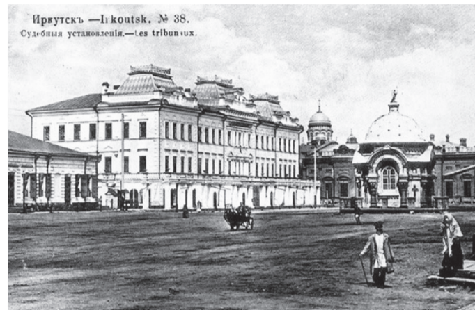
Иркутскъ — Irkoutsk. № 38. Судебныя установленія.—Les tribunaux.