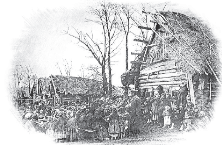
В деревне Паралевке Лукояновского уезда, Нижегородской губернии. Рисунок с фотографии М.П. Дмитриева

(Из Отчета СПб. Совета с 1 марта 1891 по 1 марта 1892 г. С. 22–23.)